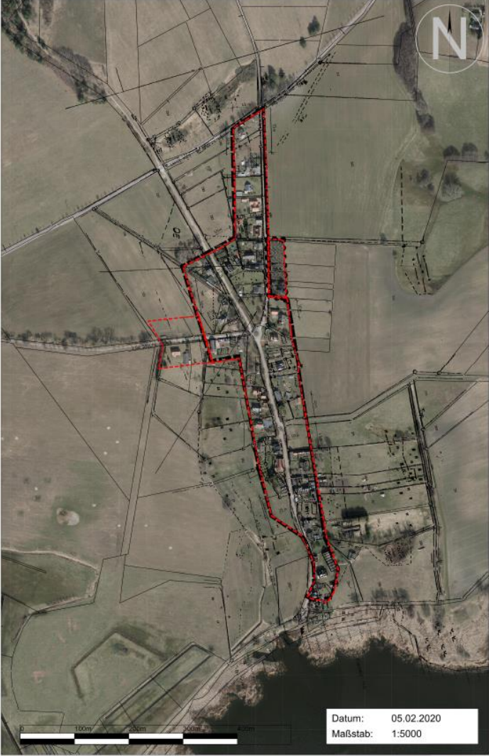
Anlage B: Geltungsbereich für den Ortsteil Gummlin