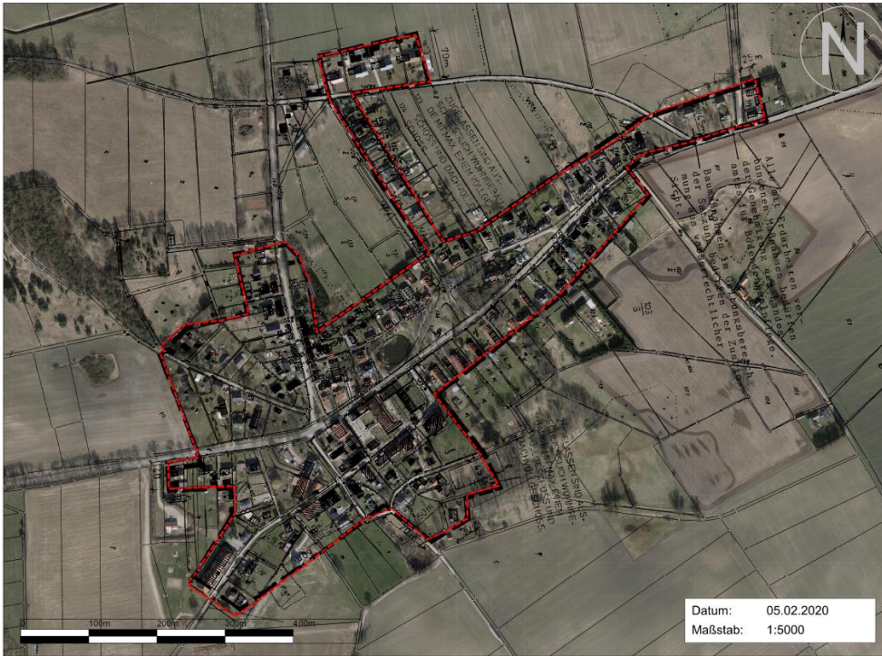
Anlage A: Geltungsbereich für den Ortsteil Stolpe