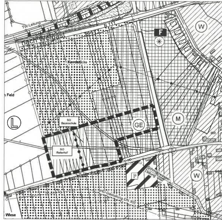
Ausschnitt aus dem wirksamen Flächennutzungsplan (nachrichtliche Darstellung)